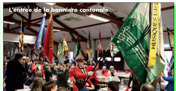
L'entrée de la bannière cantonale